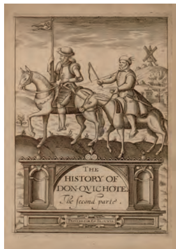
Miguel de Cervantes Saavedra The second part of the history of the valorous and witty knight-errant, Don Quixote of the Mancha London, 1620 Biblioteca Nacional de España: Cerv.Sedó/8676

Y por último, el tercer eje de la exposición se centra en la construcción del mito Miguel de Cervantes, donde se retoman algunas de las ideas, de los datos expuestos en las secciones anteriores. Por un lado, se indaga en la celebración de Cervantes como escritor que tendrá su particular geografía: Inglaterra; y sus protagonistas serán los escritores que encontrarán en Cervantes un modelo de escritor, y en su Don Quijote un libro digno de ser imitado. Una particular lectura de la obra cervantina alejada de los torrentes de carcajadas y de risas con los que iba triunfando en el resto de Europa. En la construcción del Miguel de Cervantes mito vamos a detenernos en dos episodios históricos esenciales: la guerra de África (1859-1860) y la crisis de 1898; así como en su presencia en monumentos de plazas y calles. Desde el de 1835 a las puertas del Congreso de los Diputados, el primero que se dedica a un civil en Madrid, hasta el gran monumento en Plaza de España a principios del siglo xx, que pondrá su punto y final más de cincuenta años después.