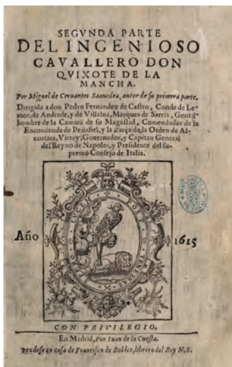
Miguel de Cervantes Saavedra Segunda parte del ingenioso caballero don Quixote de la Mancha Madrid, 1615 Biblioteca Nacional de España: Cerv/119