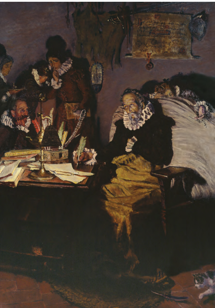
Antonio Muñoz Degraín Cervantes escribiendo la dedicatoria de su obra al conde de Lemos, 1916 Óleo Biblioteca Nacional de España: Inventario/380